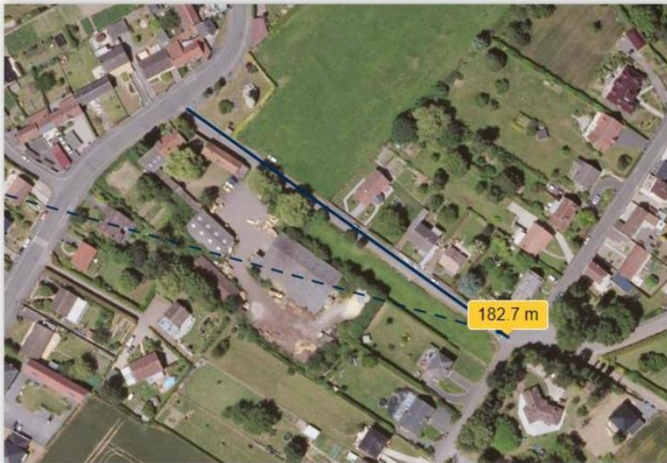
Rue de la chapelle – Arleux en Gohelle