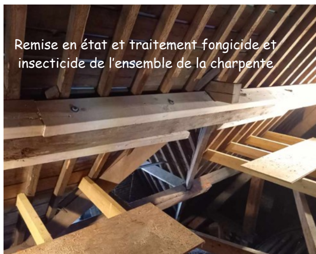
Remise en état et traitement fongicide et insecticide de l'ensemble de la charpente