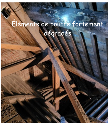
Éléments de poutre fortement dégradés