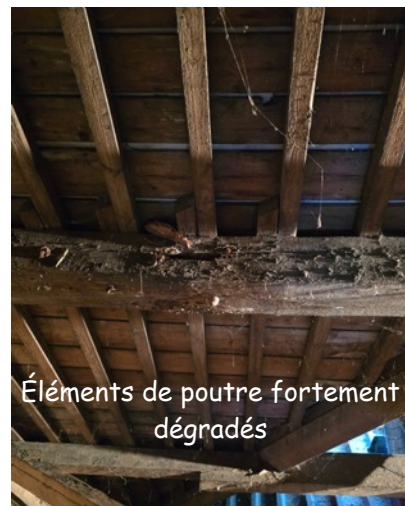
Éléments de poutre fortement dégradés