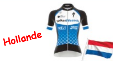
VOLKERWESSELS WOMEN'S PRO CT