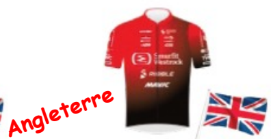
SMURFIT WESTROCK CT