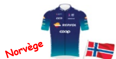
TEAM COOP- REPSOL