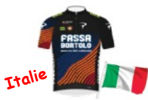
TOP GIRLS FASSA BORTOLO