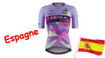
LABORAL KUTXKA- FUNDACION EUSKADI