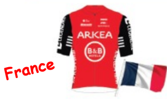
ARKEA B&B HOTELS WOMEN