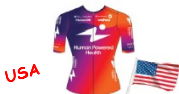
HUMAN POWERED HEALTH