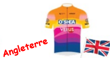
CJ O'SHEA RACING TEAM