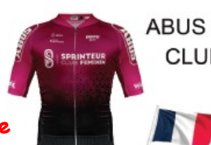
ABUS SPRINTEUR CLUB FÉMININ