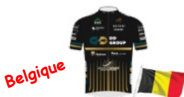
DD GROUP PRO CYCLING TEAM