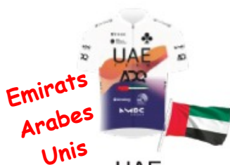
UAE DEV TEAM