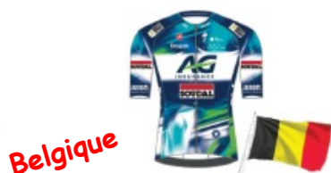
AG INSURANCE SOUDAL TEAM