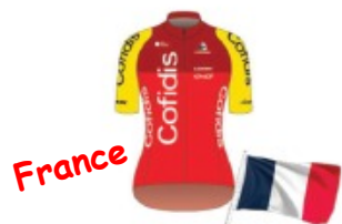
COFIDIS WOMEN TEAM